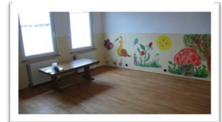
2 kleinerer Raum oben, März 2011