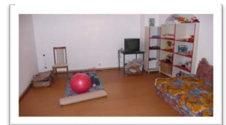
3 großer Musikraum