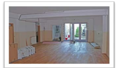
1 großer Aufenthaltsraum unten, Aug 2010