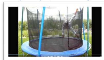
5 übt jetzt fliegen (screenshot v. clip)

Wir hatten in diesem Jahr wegen der bürokratischen Verzögerungen die weitere Entwicklung zunächst abgewartet und deshalb auch keine Mitgliederbeiträge eingezogen oder zusätzliche Mittel eingeworben. Mit dem Abschluss der Bautätigkeiten beginnt nun eine neue Phase. Die Mitgliederversammlung hat deshalb u. a. beschlossen, neben der bisher fallweisen Mittelüberweisung durch nun regelmäßige Monatszahlungen von 400 Euro mehr Kontinuität und Verlässlichkeit in das Projekt und vor allem in die Personalsituation zu bringen. Mit diesem Betrag können wir unter lokalen Bedingungen den derzeitigen Betrieb und die Basis für eine weitere Entwicklung sichern.